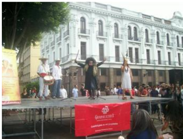
Deslocalización y espectacularización de la danza de tastoanes.

en número de participantes y en tiempo de la celebración original del ritual. Y también está el caso de la poco difundida “ Semana de los Tastoanes ” celebrada del 17 al 21 de octubre de 2011, en el marco de la celebración de los juegos Panamericanos en Guadalajara, realizada en la Plaza Bicentenario de la Biblioteca Pública del Estado, en la que cada día participaba una cuadrilla diferente de tastoanes del municipio de Zapopan: Ixcatán, Nextipac, Santa Ana Tepetitlán, Jocotán y San Juan de Ocotán. Y cuya difusión en prensa se acompañó de la iniciativa de la Secretaría de Cultura de Zapopan por proponer a esta danza para que fuera reconocida como Patrimonio Cultural e Intangible de la Humanidad, por la Organización de las Naciones Unidas para la Educación, la Ciencia y la Cultura (UNESCO).