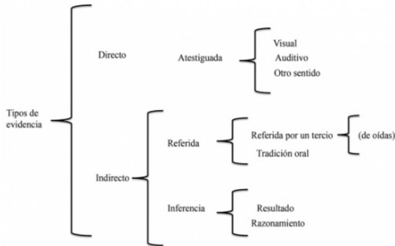
Figura 2. El modelo de tipos de evidencia según Willett (1988)

A continuación, Willett (1988) propone el siguiente esquema en el que la evidencialidad se divide en dos tipos de evidencia, la evidencia directa y la indirecta. Aquí, este concepto se define en un sentido estrecho, por tal motivo se estudia únicamente en relación con la fuente de la información.